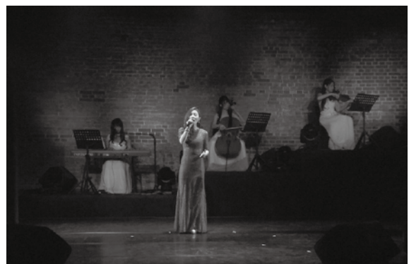
「Be Myself：昂首做自己」樂團表演。