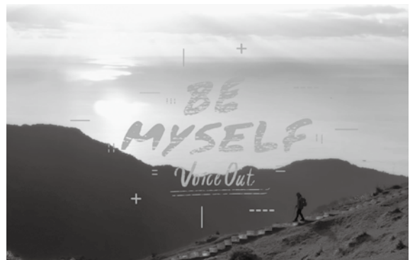
「Be Myself: Voice: Voice Out」形象短片，網址： https://tinyurl.com/te2gq25 。

效法的典範；活動下半場則以舞臺劇加上樂團表演呈現，將女性於不同領域中如何突破困境並忠於自我的樣貌表現出來，告訴所有女性：Be Myself 昂首做自己。