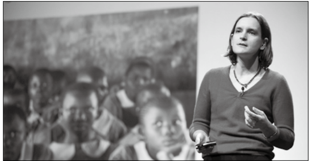
2009年Esther Duflo在Pop!Tech演講。

2019年底新一年的諾貝爾獎得主出爐，法裔美國經濟學家艾斯特·杜芙洛成為諾貝爾經濟學獎第二位女性得主，同時也是史上最年輕的經濟學獎得主。她在麻省理工學院教授發展經濟學，也共同創立了「賈米爾貧困行動實驗室」(Abdul Latif Jameel Poverty Action Lab, J-PAL)，結合經濟學的量化方法，以及實證研究的精神，在印度展開一系列的貧窮研究，並試著對症下藥地解決貧窮問題。