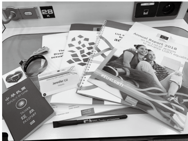
參與歐盟會議的資料，名牌的國籍上直接寫著「Taiwan」。