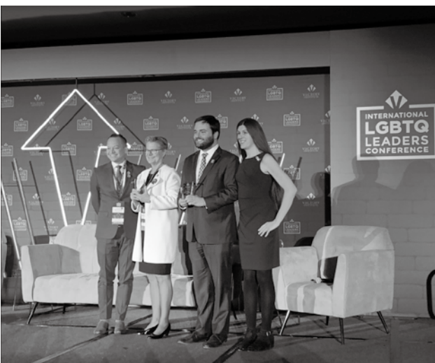
勝利國際研討會注重多元，納入跨性別與不同族裔的政治人物。

結束國際研討會後，我馬上又接著參加專業人才研究計畫的大會活動，沒想到中國參加者與香港參加者和我與另一位臺灣參與者，因為當時在香港越演越烈的反送中事件產生衝突，起因是我很單純地希望透過這個國際場合，讓更多人能關注香港當時的警察侵害人權事件，因此提出了「是否能在團體報告中穿支持香港衣服」的意見；此提議引發中國參加者的激烈抗議（或也可說恐懼），甚至威脅要退席，還有黨員說會把大家的名字都報上給政府，氣氛幾度非常緊繃。有幾位年輕的中國參與者，私下與我們表達支持，但也對公開表達意見感到恐懼，甚至不敢在手機裡打任何相關訊息。最後，臺灣和香港的參與者決定在休息時段直接跟其他參與者對話，說明香港的處境，但也因此引起國務院工作人員的關注，表示他們亦有壓力。這段經驗是我當初參與此計畫時完全沒料到，但也是影響我最多、讓我印象最深刻的部分，也讓我再次肯定臺灣的國際工作必須持續不斷地做，因為中國壓力不會變小、更不會消除，唯有我們持續地用各種方式發聲，國際才能看見臺灣的成就、同時也看見臺灣的處境。