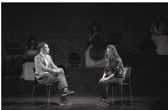
「Be Myself：昂首做自己」舞臺劇演出。