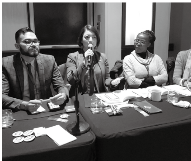
在勝利國際研討會上分享臺灣婚姻平權經驗。