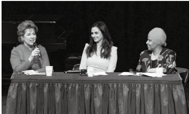
非政府組織會前會邀請CSW63主席Geraldine Byrne Nason (左)與UN Women執行長Phumzile Mlambo-Ngcuka (右)對談。

本會做為籌組我國CSW代表團之資源與資訊平台，綜觀近幾年我代表團參與CSW & NGO CSW Forum之成果，除了與會人數有持續成長的趨勢外，與會夥伴在辦理平行會議方面，皆已逐漸掌握籌組平行會議的技巧，並有效結合國際非政府組織之力量，擴大分享我國在推動性別平等與婦女賦權之行動與案例，甚至成功將所屬國際非政府組織之年會爭取來台辦理。因此，促使本會開始思考如何奠基於目前的參與成果之上，開創更有效的參與途徑。以下就近年參與的經