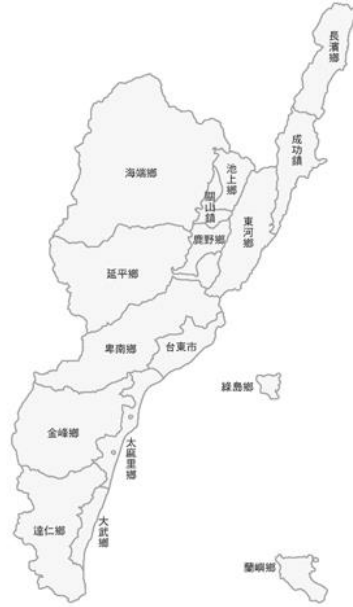
圖 2 臺東縣地理特徵

內轄有1市、2鎮、13鄉（含5個山地鄉）（見圖1）。本調查之研究對象為「目前現住在臺東縣的15歲以上~未滿65歲女性」，並以此作為抽樣母體。為避免樣本過於集中在高年齡組，除了調整調查時間，每一區（副母體）的抽樣人數將按：（1）15-18歲；（2）18歲以上~30歲；（3）31歲~45歲；（4）46歲到未滿65歲。