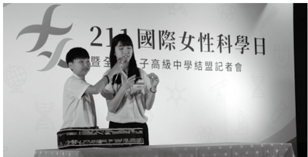
2018年1月24日高雄女中學生的現場物理實驗表演