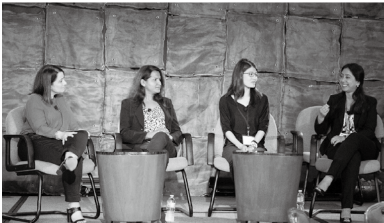
業界女性領導人於WITI女科技人年度大會上分享職場經驗

WITI自1989年成立至今已經將進30個年頭，從一個區域性的小型組織，發展至現在已經走出美洲，在世界各地設點。卡洛琳在一則訪談中提到，WITI最令她驕傲的是，她們突破了社交平臺的定義，創造有創意且新穎的運作模式，讓更多女科技人願意加入。秉持著「包容」的核心價值，她們強調絕不排除任何人，包括男性，她們也希望能夠成為科技領域中性別的溝通橋樑。未來，WITI還要結交更多產界、學界的盟友，讓女科技人的聲音被世界聽到。