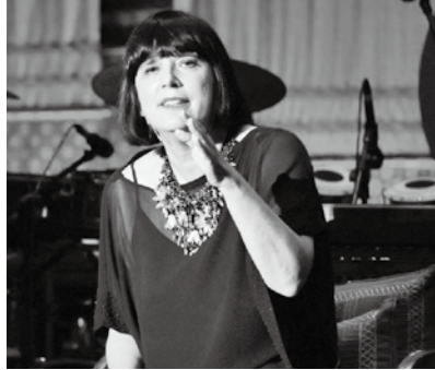
TED India 2009, 伊芙·恩斯勒正發表演說：「擁抱你的內在女孩」

剛開始，恩斯勒只是藉由一次次訪談，傾聽女人們分享自己陰道的故事，然後將之撰寫成劇本表演出來。隨著演出擴大，許多女人開始在她表演結束時，排隊向恩斯勒訴說她們的故事；令恩斯勒深感震驚的是，這些女人們向她訴說的故事，並不是她們怎樣享受高潮、精彩性生活、如何愛惜自己的陰道；有九成是一個又一個殘忍恐怖，關於女人怎樣被遺棄、被虐待、被毒打，甚至被強姦的故事。根據聯合國資料，全球也統計高達10億名婦女曾經或正在遭受性侵。這讓恩斯勒感到