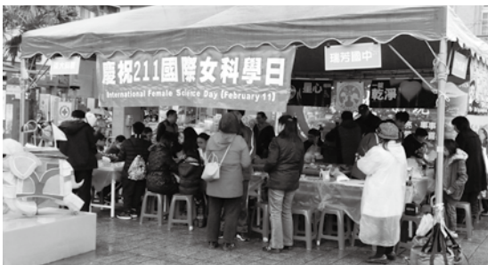
淡江大學和瑞芳國中合作指導群眾利用簡單原理製作元宵提燈和環保清潔劑

都，更深入偏鄉小站，如瑞芳、竹南、員林、斗六、斗南、新營、保安、岡山、鳳山、屏東、知本、光復、羅東、宜蘭等臺鐵車站，甚至離島澎湖也有澎湖科技大學聯合當地的國高中，在市中心辦理科學活動一起響應。