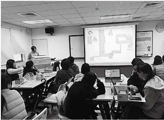
防災救火的程式設計課程現場參與