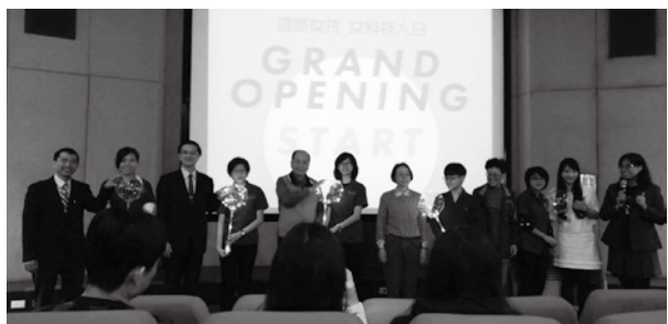
台灣女科技人學會與北一女少女防火志工在臺北市防災科教館為211國際女性科學日的首波宣傳活動

費由正在執行科技部計畫的團隊支付，多數活動都在沒有計畫經費支持下主動去尋找資源，義務參與響應。