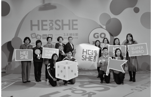
2018年國際婦女節慶祝活動以「HE FOR SHE 妳我一起」為主題

近年來，我國在性別平權指標的表現確實有長足的進步與發展，國人也已相當重視婦女權益，但文化禮俗及細微的日常生活中仍存在隱性的性別刻板印象與不平等觀念，而女性權益也常在這些無形的性別偏見中被