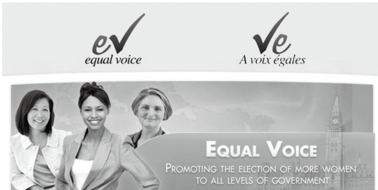
促進女性參與各項政府決策是Equal Voice的重點任務，圖片來源：Equal Voice

期光是「女性政治培力計畫」就核准了15個提案，共3,382,000元（合臺幣約7,800萬）款項。