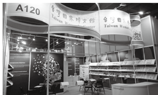
台灣國家婦女館展攤

廳舉辦「一起煮飯吧！親子繪本分享會」，邀請知名圖文作家池依林老師蒞臨現場，分享輕鬆逗趣的繪本主題與簡單易入門的性別意識教學，所有參與的大小讀者都能藉此學習性別意識，成功地推廣了性別平權的概念。本次共有55位觀展民眾熱情參與分享會，演講廳霎時一位難求；另本次展出期間，共有2,503位熱情民眾到訪台灣國家婦女館書展攤位，觀看優良性別好書，並分享自身的性別意識觀點與經驗。