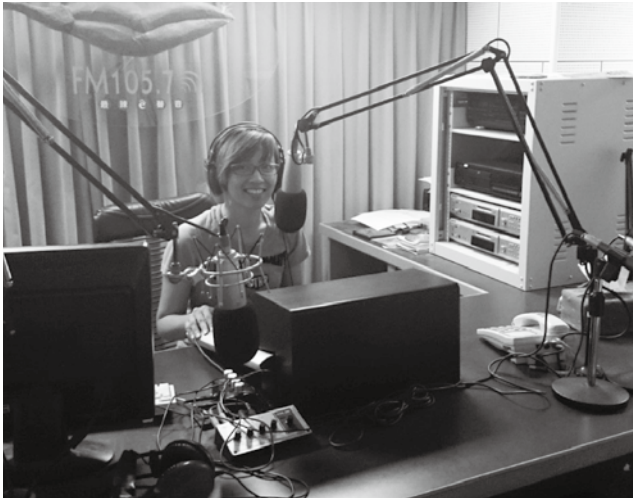
在虎尾的姊妹電臺小小錄音室，能將性平宣導傳播給10萬人次收聽。