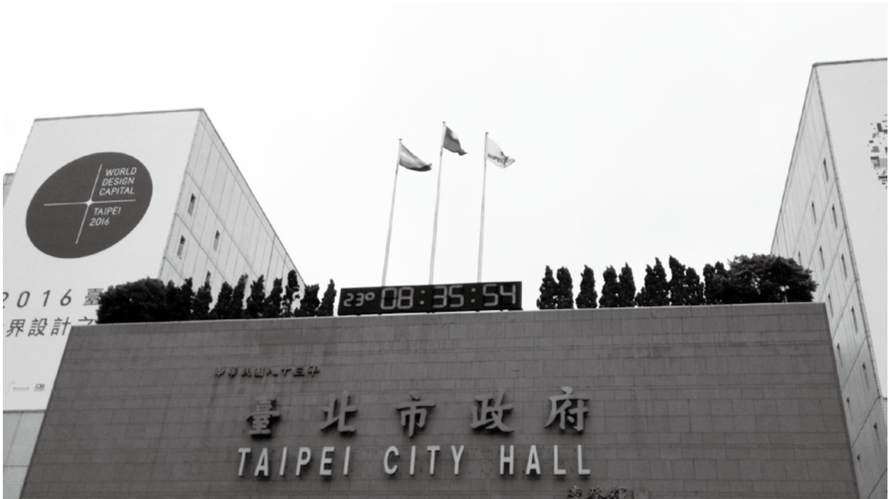
臺北市政府升旗彩虹旗

臺北市政府作為動見觀瞻的國際之都，在性別平等及同志平權的議題上，一直引領全國之先。奠基於城市蓬勃的公民運動與人權至上的治理信念，市府長期以來對於創造友善同志環境的推展不遺餘力。尤其是透過全國首創促進同志權益之公私協力平臺「同志業務聯繫會報」與整合規劃全市性別平等政策之「性別平等辦公室」，開創一系列實質措施，並帶動其他地方政府投入，全面增進臺灣社會對於同志議題的理解，促進整體同志權益的提升。