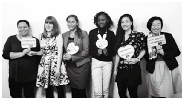
青年代表團主辦之平行會議「消除各種形式之厭女文化及有害的社會規範以促進婦女經濟賦」與談人合影。

延續今年大會的三個主題之討論亦呼應明年，明(2018)年「永續發展高階政治領袖論壇」主題 4 ，CSW將第62屆大會優先主題定調為「達成性別平等與偏鄉婦女賦權的機會與挑戰」(Challenges and opportunities in