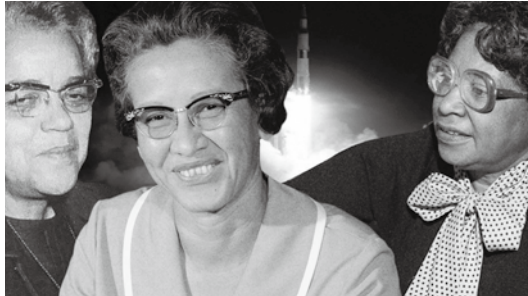
Katherine Johnson、Mary Jackson及Dorothy Vaughan

俗諺有云「成功的男人背後都有一個偉大的女人」，這句話雖然老梗，但放在第一個成功進入地球軌道繞行的美國太空人John Glenn 1 身上似乎也適用。只是大多數人只記得John Glenn是英雄，而不會知道成就這項奇蹟的背後還有一群偉大的英雌。