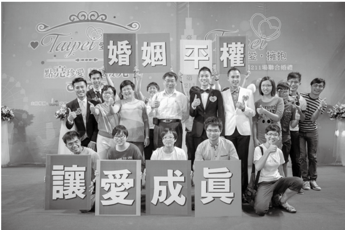
同性伴侶參與臺北市聯合婚禮

正是這一連串開創性作為與後續的社會影響，讓臺北市政府以「營造友善同志環境」一案，榮獲行政院第15屆金馨獎「性別平等創新獎」 1 。現階段，婚姻平權修法草案在臺灣社會正引發廣大的討論；然而，人權政府無法坐視的是同志朋友承受的每日壓迫與生命艱難。臺北市政府目前所做的努力，正是在試圖填補這段法律的空窗，在法律與社會間進行對話，引領性別平等的新時代早日到來。