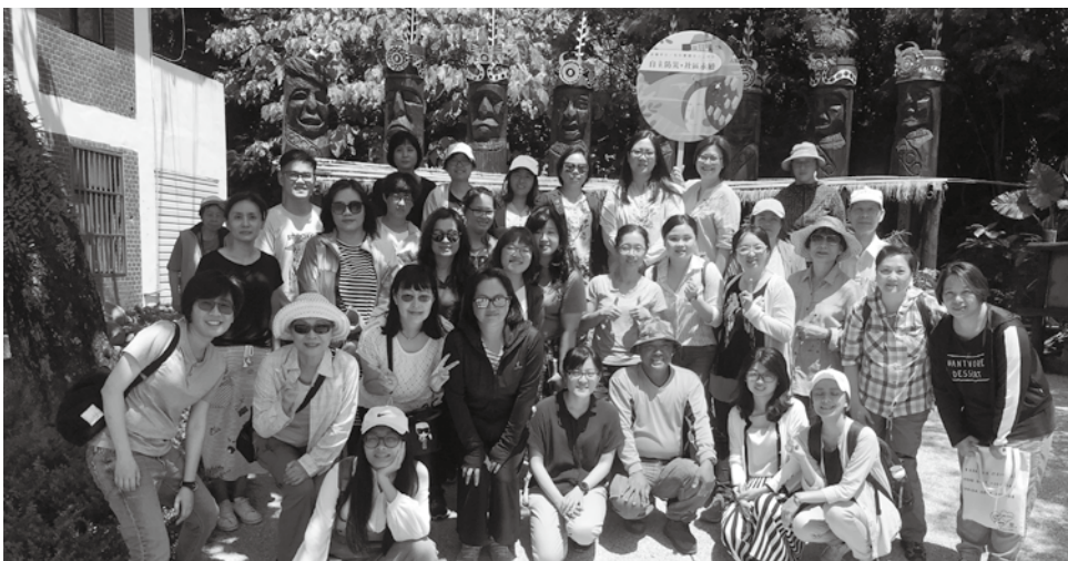
「自主防災・社區永續」北區場學員在忠順社區合影。

總結學員對工作坊的意見回饋，許多人表示從未想過災難與性別的關係，在工作坊中認識問題及討論對策是項難得的學習。有婦女中心的夥伴希望能將這套課程，萃取成中心的培力課程，而來自社區及消防單位的夥伴也找出各自能為性別平等著力的立基點，期待「無處不性別」的理念在各領域扎根茁壯，未來相關的研究與討論更加蓬勃發展。