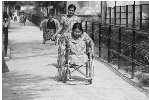
NIDWAN致力於倡議遭受交叉性歧視群體的權利。

礙特質時，處境尤其艱困，NIDWAN提供同儕輔導、自助支持與表達主張的訓練，因為他們相信，培力是創造女性生命改變以及致力永續生活的關鍵。