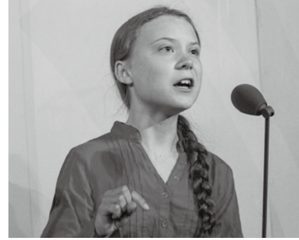
青年氣候行動鬥士Greta Thunberg在氣候行動高峰會上演說。

規劃Beijing+25的檢視工作，其發布的國家檢視報告準則 7 中，便明確地拉出從國家層級到全球層面的工作時程，並將《北京宣言暨行動綱領》12項關鍵領域（critical areas）融合SDGs的5P 8 精神，收斂為以下六個專題群組（thematic clusters）：