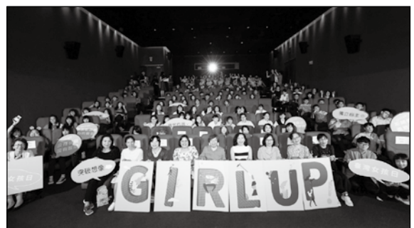
「Girl Up! 女孩力」巡迴影展透過影像鼓勵女孩勇敢做自己。

影展在衛生福利部次長蘇麗瓊領聲高喊「Girl Up! 女孩力」中正式開跑！蘇次長並以瑞典女孩「環保鬥士」桑伯格為例，勉勵女孩不要小看自己的力量。本次活動也邀請藝人孟耿如擔任大使，與現場女孩共同撕去一條條箝制女孩發展的刻板標籤，一起「我撕／思，故我在」。孟耿如以自身追夢的成長經驗向女孩喊話「不要自己設定框架，只要勇敢踏出，人生都可以過得很精彩。」現場並播映影展電影短片《跼腳尖》及《泳隊》，導演更親身到場與在座學生分享創作想法。