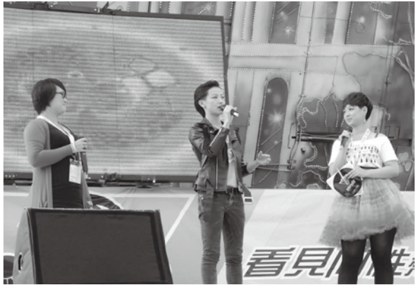
2013年第11屆臺灣同志遊行，何韻詩透過歌聲表達支持。

除了香港的同志遊行，何韻詩近年來也曾多次聲援臺灣的同志運動，2013年第11屆臺灣同志大遊行，她在舞臺上藉著歌聲表演，表達以愛擁抱多樣特異。2016年世界人權日，何韻詩來臺聲援挺同團體在凱道舉辦的活動時表示，臺灣同志議題討論到修改《民法》讓人振奮，身為爭取同志平權的一份子，她非常希望臺灣能成為亞洲第一個同性婚姻法制化的地方。2018年年底公投，修《民法》案雖未能通過，卻也確認了另立同婚專法的基礎，直至2019年5月，立法院三讀通過後經總統公布《司法院釋字第七四八號解釋施行法》，臺灣成為亞洲首個承認同性婚姻的國家。