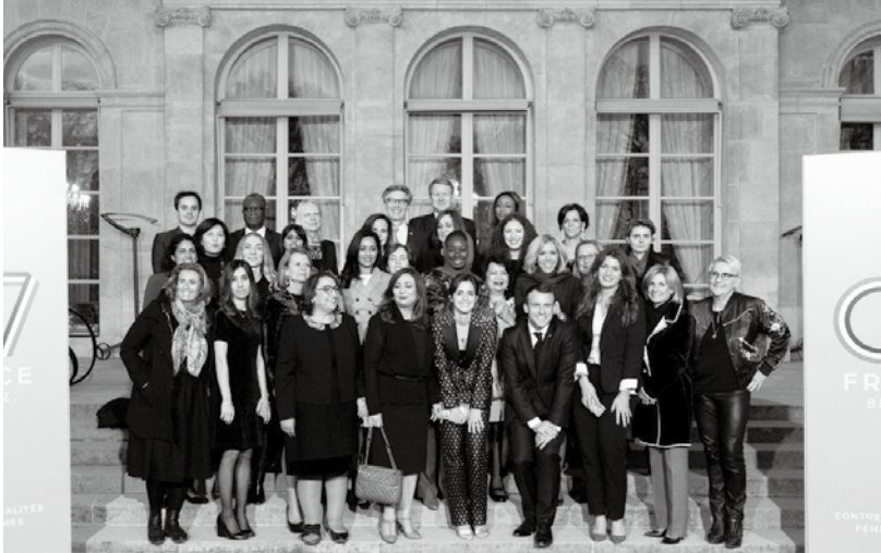
G7高峰會主辦國法國總統邀請全球性別平等重要推手在總統府會面。