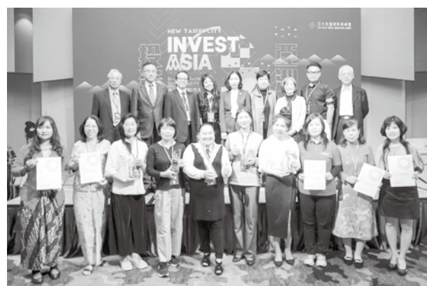
「女力創業發表」亮點平臺新住民創業女性合影。

兩日峰會為臺灣社會創新注入新的能量,誠如唐鳳政委對於社會創新的期許——「開門造車」持續推動開放式創新,成為社會進步最強的動能!