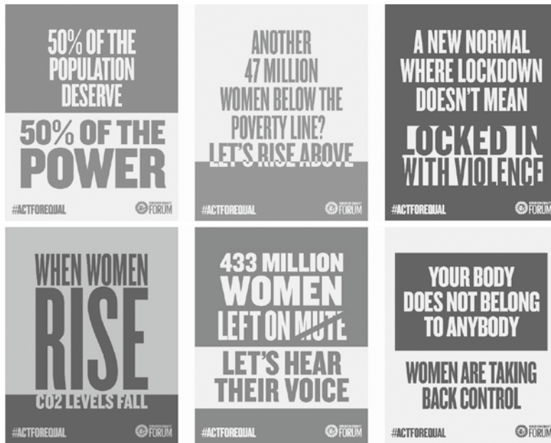
全球加速計畫涵蓋六大議題領域及行動方案， 圖片來源：Generation Equality Forum

設置安全合法且容易取得的避孕服務，並強力支持倡議該議題的組織、網絡以及公民運動。