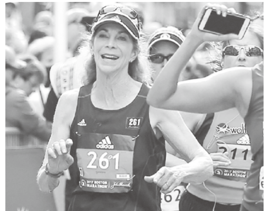
2017年再次參加波士頓馬拉松的斯威策。

除了鼓勵更多女性裁判與教練增加專業知能，爭取擔任更高階職位外，也持續關注國內外女性參與體育事務及進入領導決策層之現況與困境，以及女性職業運動員的發展等議題。