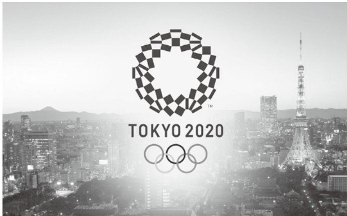
東京奧運因COVID-19疫情延期，今年將以無觀眾方式舉行。