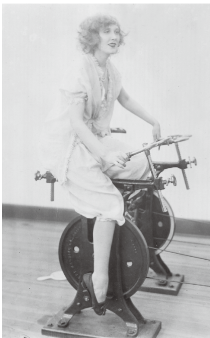
1920年代室內運動的女人。

過去，女性的身體被認為不適合運動，不乏有人疾呼女性運動會導致子宮下垂、月經閉鎖或影響骨質密度。看到1920年代女性在室內運動的照片，現代的女生應該會覺得非常不可思議，為什麼運動要妝髮完整，穿著裙子、高跟鞋踩腳踏車？當時女性不能拋頭露面的想法，深深影響了女性在運動中的穿著和空間，不但只能夠在室內運動，而且要把身體包著嚴嚴實實。更重要的是，在運動的過程中，仍然要「像個女人」。直至今日，身體、服裝跟空間，依然是婦女運動和性別平等的重要議題，以下來看在運動領域的