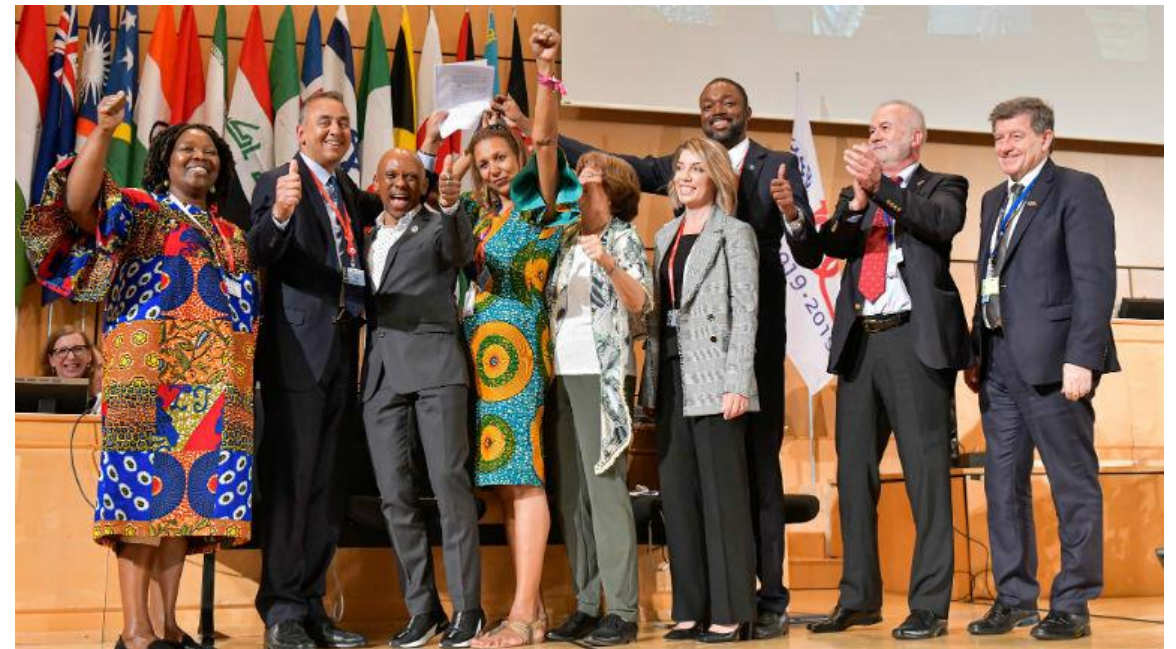
日內瓦（國際勞工組織新聞）——國際勞工大會通過了一項新的公約及配套建議書，旨在打擊勞動世界的暴力和騷擾。

6月，國際勞工組織通過了一項新的公約和建議書，以打擊工作中的暴力和騷擾。《暴力與騷擾公約》和《暴力與騷擾建議書》，承認工作中的暴力和騷擾是對人權的侵犯，並威脅著平等機會。