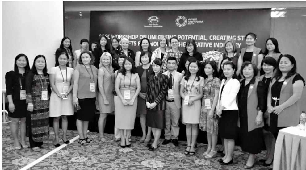
女性運用新科技展現創作力工作坊與會者合照。

在菲律賓、俄羅斯、秘魯及2018年主辦國巴布亞紐幾內亞的玉成下，辦理「APEC女性運用新科技展現創作力工作坊」(APEC Workshop on Unlocking potential, creating style - APEC GIFTS for women in the creative industry)，以「文化、科技與性別：來自創新的洞察」與「在地、區域與國際的文創策略」兩大命題，探討女性如何在文化傳承、創意發想的道路上，締造社會整體包容、投入經濟活動，以及透過創新教育訓練、優化就業條件、保障智慧財產、拓展海外市場等政策，於藝術創作與生計維持間獲得更自在的發展；此願景亦與大會主題、聯合國2030年永續發展目標(Sustainable Development Goals)第8.3/8.9項、聯合國教科文組織(United Nations Education Scientific and Cultural Organization)2014至2021年中期戰略之核心價值若合符節。