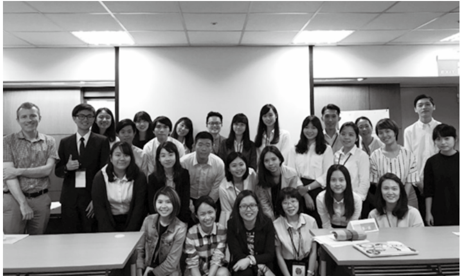
2018 NGO CSW Forum青年代表團甄選活動—發表會合影。

為提高我國青年對國際性別議題之瞭解並延續初階訓練課程之培訓成果，本會於9月16日假外交部外交及國際事務學院舉辦「第六屆性別暨國際事務青年人才進階培訓營」。課程內容以國際參與實務為主軸，邀請具豐富外交實務經驗之工作者，與學員對談國際參與實務經驗，協助學員勾勒出參與國際會議應建構的能力。