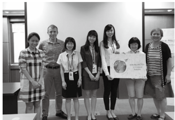
2018 NGO CSW Forum青年代表團與評審委員。

「增強婦女使用媒體與資通訊科技傳播的能力」為原則，各團隊就其所選定之議題以英文進行簡報，並接受評審提問。學員們的報告主題分別包含了：新住民的雙重文化認同議題、網路上的復仇式色情議題、偏鄉婦女的領導力培養與經濟賦權、偏鄉地區的資通訊科技的進用以及性教育與性別平等教育等。活動最後由評審團根據評選標準，選出由國立臺灣大學、國立政治大學與輔仁大學學生所組成的團隊為「2018 NGO CSW Forum青年代表團」，並預計於明年的「非政府組織婦女地位委員會週邊論壇」中舉辦一場名為「網路時代下，偏鄉婦女的機會與挑戰」的平行會議。