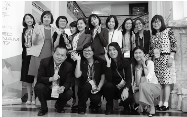
我國代表團成員合照。